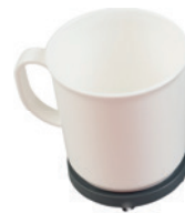
MYRO® objekt za primjenu sile