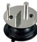
MYRO® objekt za primjenu sile