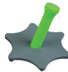
MYRO® objekt za hvat